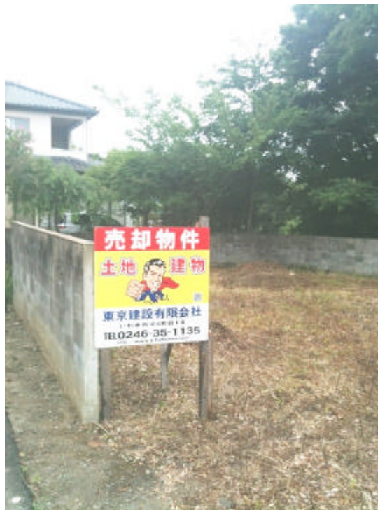
現況と図面が異なる場合は、現況優先と致します。